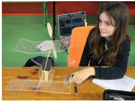
Cette jeune concurrente semble très appliquée et note tout ce qui concerne son modèle.

Au sens figuré s'entend... Il faut surtout noter une bonne participation de (parfois très) jeunes modélistes, puisque sur 18 inscrits, un tiers est constitué de juniors. Devant cette