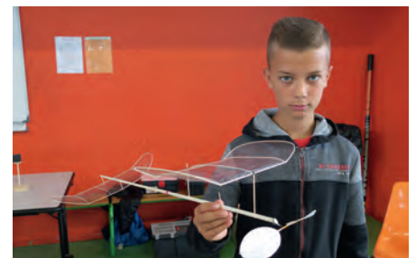
Il reste fort heureusement des jeunes qui apprécient la technicité et la précision du vol libre d'intérieur.